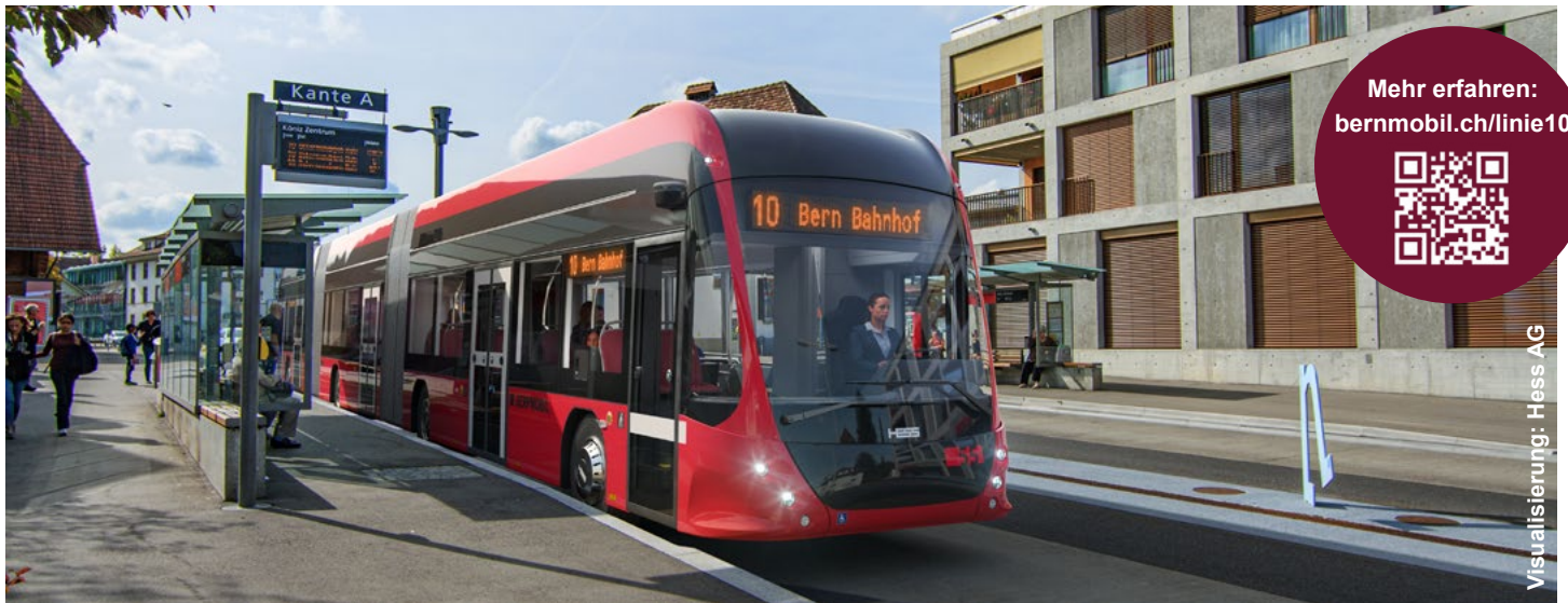
Umstellung Buslinie 10 auf Doppelgelenktrolleybusse